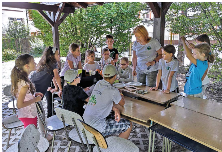
Obr. č. 28: Těrlický příměstský tábor