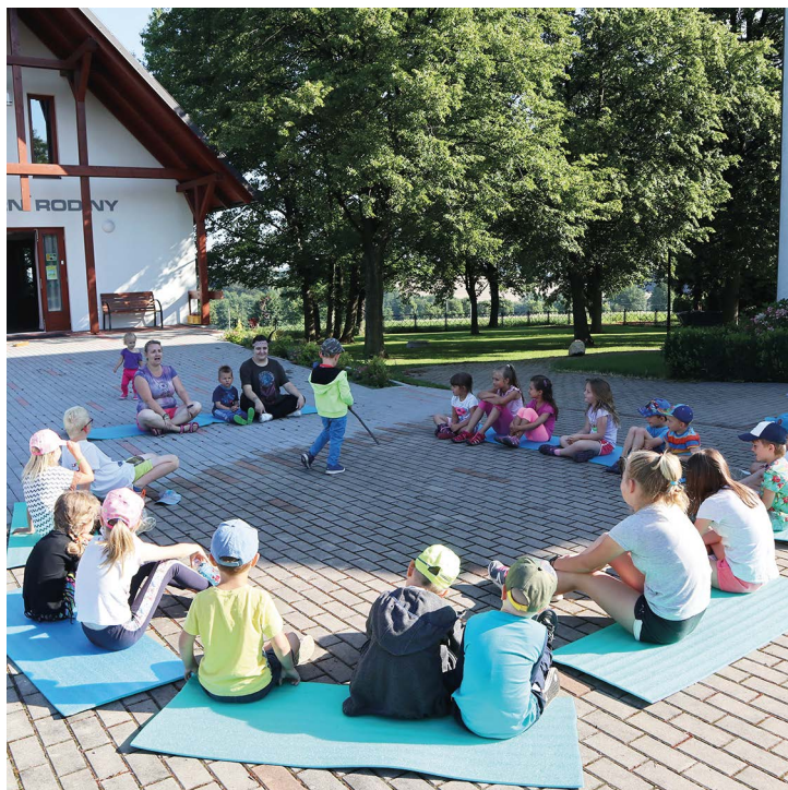
Obr. č. 9: Komunitní centrum v Soběšovicích