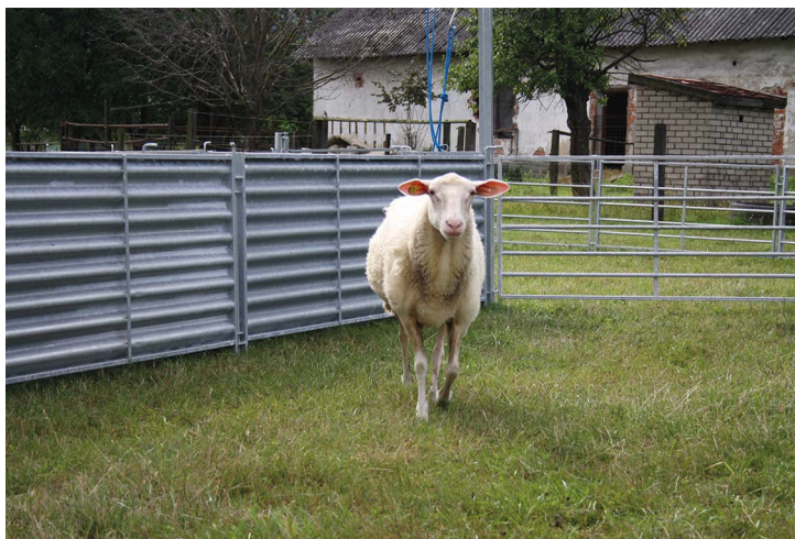
Obr. č. 12: A. Struhalová – Zlepšení welfare v chovu ovcí