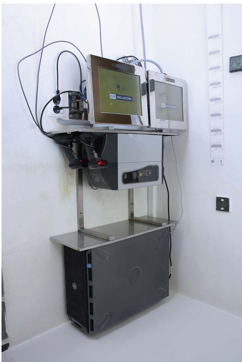
Obr. č. 17: Pekařství Fryčovice – Navažovací systém