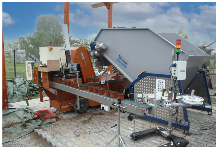
Obr. č. 14: Zahradnictví Pavlas – Veselé hrnkování