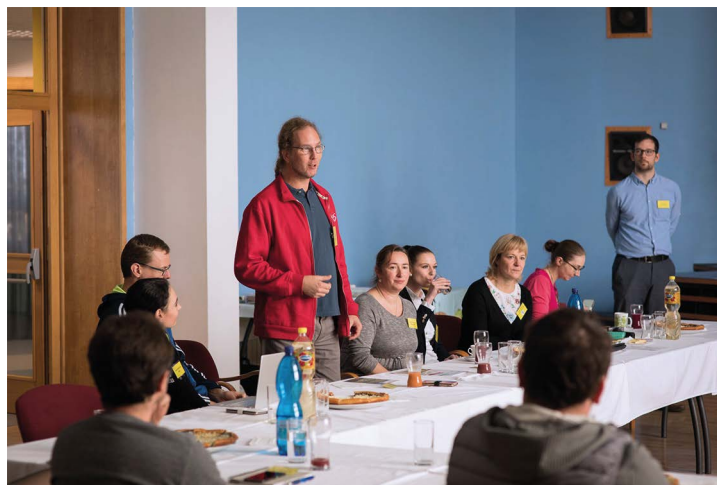
Obr. č. 29: Workshop „Jak uspět v prodeji lokálních produktů?“

Od roku 2008 jsme partnerem Celostátní sítě pro venkov – komunikační platformy Programu rozvoje venkova, jejímž posláním je, mezi jinými, zvýšit zapojení zúčastněných stran do provádění rozvoje venkova a podpořit inovace v zemědělství, produkci potravin, lesnictví a venkovských oblastech. V roce 2019 jsme byli spoluorganizátory již tradičního setkání „Z pole rovnou do kuchyně III“ (30. 10. 2019, Ostrava) a dále workshopu „Jak uspět v prodeji lokálních produktů?“ (15. 11. 2019, Hukvaldy).