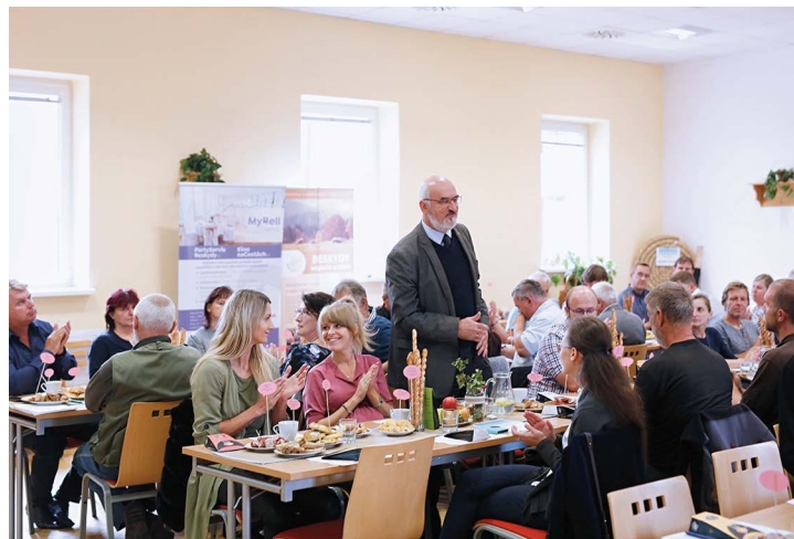
Obr. č. 20: „Konference Pobeskydí se nestydí“