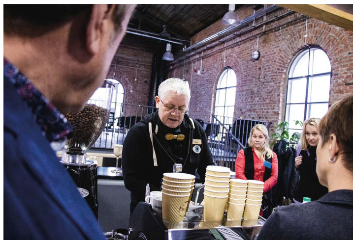
Obr. č. 30: Setkání „Z pole rovnou do kuchyně III“