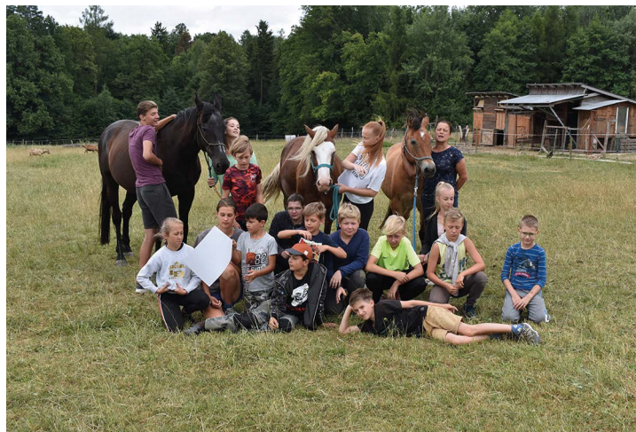
Obr. č. 27: Tábor na farmě v Bruzovicích