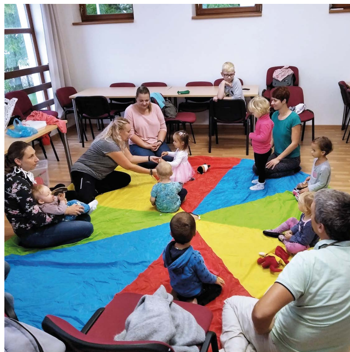
Obr. č. 10: Komunitní centrum v Soběšovicích

„Vytváříme místa pro setkávání obyvatel“