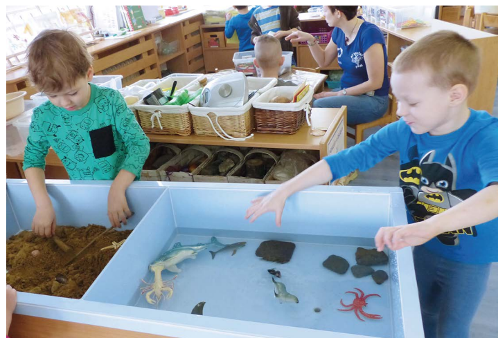
Obr. č. 23: Voda & písek