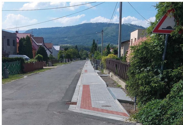
Obr. č. 6: Chodník v Hnojníku