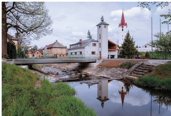
Obr. č. 5: Lávka v Palkovicích

V programovém rámci IROP bylo do konce roku 2019 vyhlášeno celkem 7 výzev. V těchto výzvách bylo předloženo celkem 40 žádostí o podporu, z toho 20 žádostí bylo MAS Pobeskydí doporučeno k realizaci a 14 žádostí bylo ve fázi hodnocení. Ke konci roku bylo 18 projektů fyzicky dokončeno, 1 projekt byl v realizaci a 1 projekt čekal na schválení ze strany řídicího orgánu, kterým je Ministerstvo pro místní rozvoj.