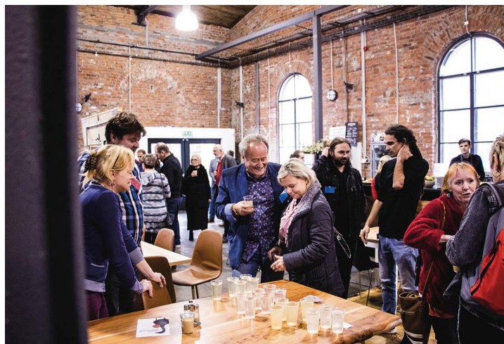
Obr. č. 32: Setkání „Z pole rovnou do kuchyně III“