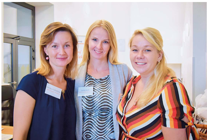
Obr. č. 3: Zaměstnanci MAP Frýdek-Místek II