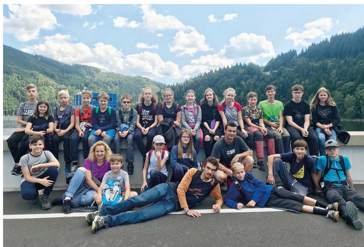
Obr. č. 22: Matematicko-fyzikální soustředění