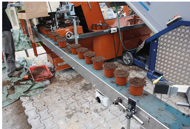
Obr. č. 13: Zahradnictví Pavlas – Veselé hrnkování

Programový rámec Programu rozvoje venkova podporuje místní hospodářství, a to zejména podporou projektů v zemědělství, potravinářství i nezemědělských oborech. V první a druhé výzvě jsme vybrali k podpoře 25 a 42 projektů. Ke konci roku 2019 již byly dokončeny všechny projekty první a druhé výzvy (celkem 55). V průběhu realizace od žádosti odstoupilo 12 žadatelů (prostředky jsou využity v dalších vyhlašovaných výzvách).