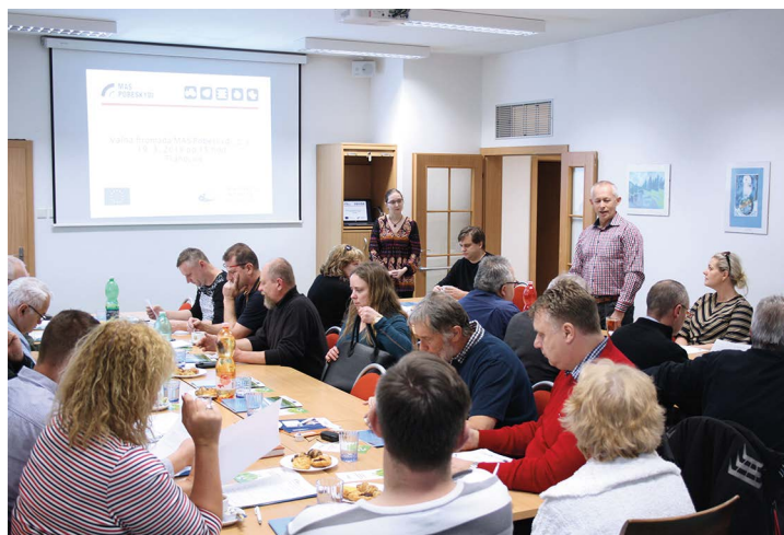
Obr. č. 2: Valná hromada 19. března 2020