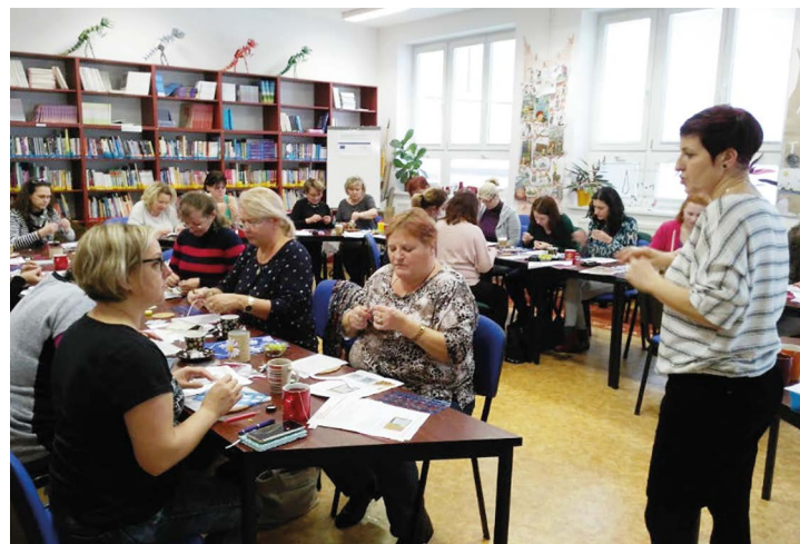
Obr. č. 25: Metodický klub školních družin a klubů