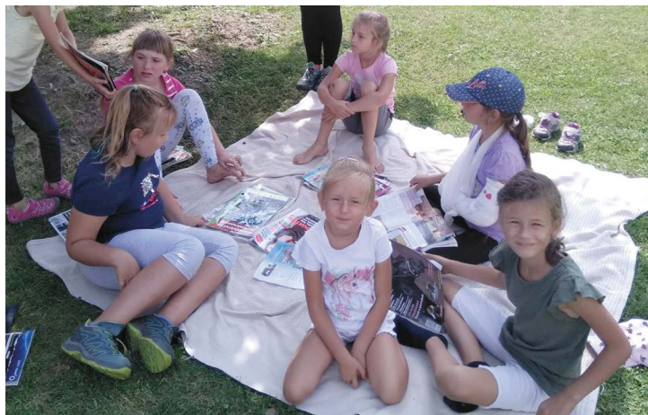
Obr. č. 26: Pony kemp ve Vělopolí

Do třetí výzvy MAS Pobeskydí v programovém rámci OPZ podala MAS Pobeskydí vlastní projekt, kterým chtěla otestovat realizaci příměstských táborů v Pobeskydí. Projekt „Příměstské tábory v Pobeskydí“ byl podpořen stoprocentní dotací 1,7 mil. Kč. V roce 2019 proběhly příměstské tábory v 7 lokalitách Pobeskydí, a to v Bruzovicích, Dobraticích, Fryčovicích, Kozlovicích, Hukvaldech, Těrlicku a Vělopolí. Celkem jsme zrealizovali 13 turnusů, které využilo více než 182 rodin. Z projektu bylo hrazeno zajištění hlídání, pronájem prostor, drobné vybavení, pomůcky a materiál, a pro každý turnus jedna animační akce. V roce 2019 byly do programu některých táborů zahrnuty polytechnické a badatelské aktivity. Děti si během táborů mohly vyzkoušet různé sporty, vč. golfu, fotbalu, jezdeckví a hasičského sportu. Tvořily v keramické dílně a kuchyňkách. Poznávaly život na farmě. Příměstské tábory budou pokračovat i v dalších letech.