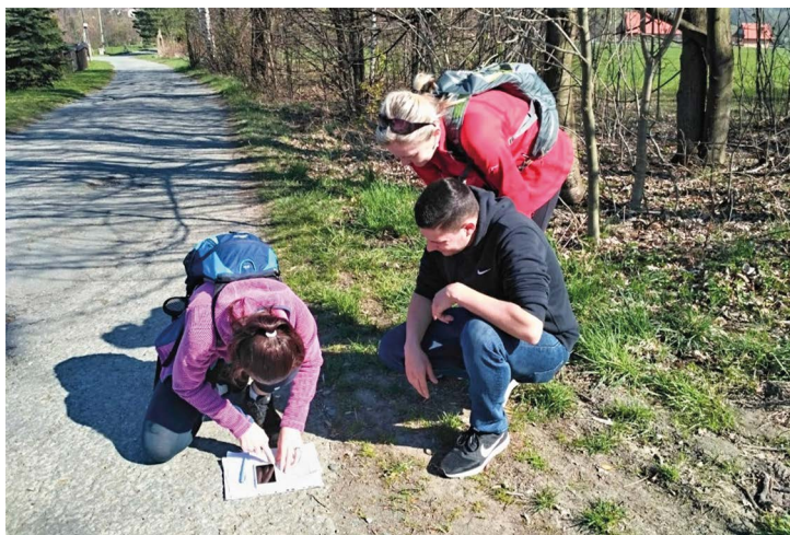
Obr. č. 24: Objev kraj, Rašek ráj