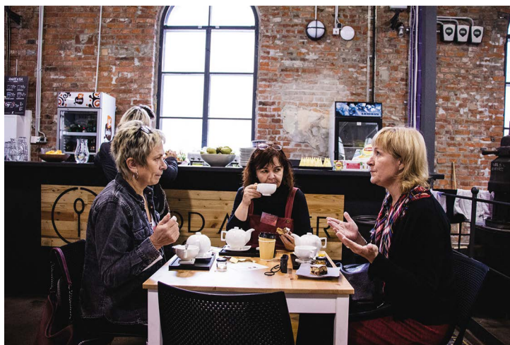
Obr. č. 29: Setkání „Z pole rovnou do kuchyně III“