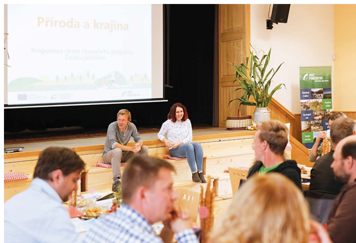
Obr. č. 21: „Konference Pobeskydí se nestydí“