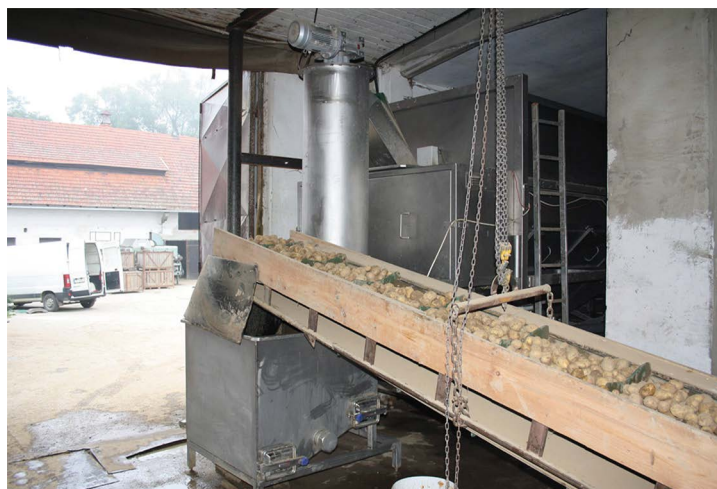
Obr. č. 15 a obr. č. 16: Jaromír Kublák – Investice do zpracování brambor

„Přibližujeme místní potraviny místním lidem“