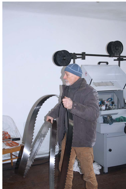
Obr. č. 18: L. Chlumský – Pořízení ostříčky pásových pil