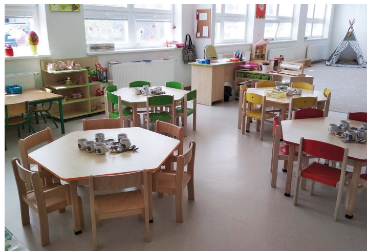
Obr. č. 8: Mateřská škola ve Smilovicích

„Podporujeme školy a školky plné nových zážitků a inspirace“