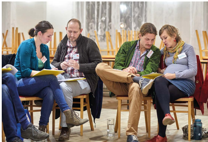
Obr. č. 11: Setkání k posílení rodičovských kompetencí

Cílem projektu je prevence sociálního vyloučení posílením rodinných a rodičovských kompetencí, rozvojem komunikačních a psychosociálních dovedností, posílením osobních kompetencí v běžném životě u rodin pečujících o děti. Tím projekt také přispívá k posílení jejich sebedůvěry pro zapojení do komunity a obnovení či upevnění kontaktu s přirozeným sociálním prostředím. Projekt byl v roce 2019 ukončen a v roce 2020 budou aktivity pokračovat v navazujícím projektu „Kompetence pro stabilnější rodinu II“.