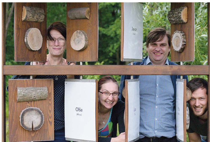
Obr. č. 1: Zaměstanci MAS Pobeskydí