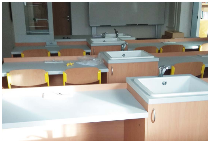
Obr. č. 7: Odborná učebna v Hnojníku