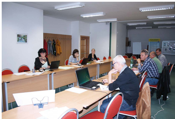
Obr. č. 4: Výběřová komise 4. listopadu 2020